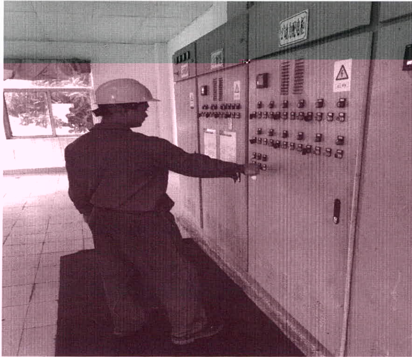
机修人员调整提升泵功率