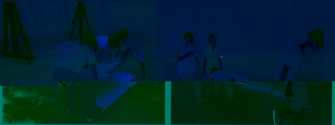
将伤员转移至安全区域