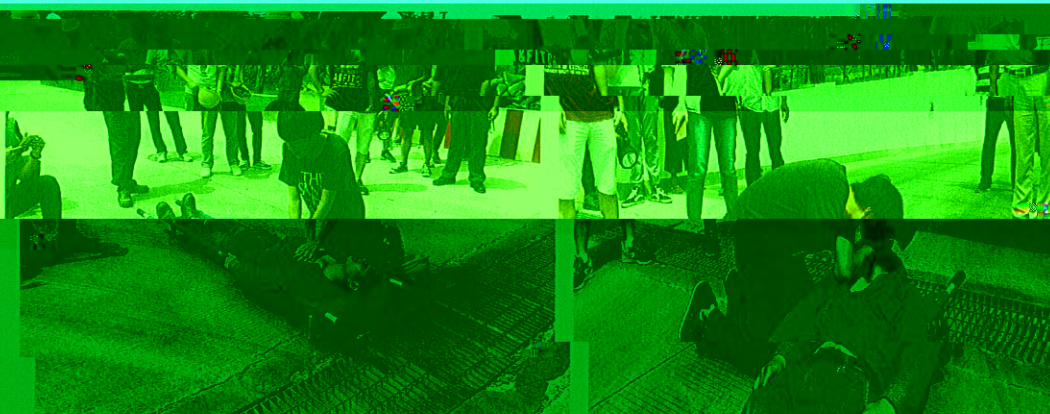
对伤员进行心肺复苏