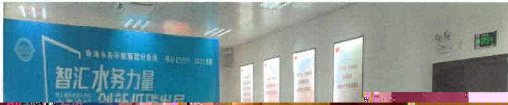
图 3. 积极参加“粤港澳大湾区水务论坛”活动