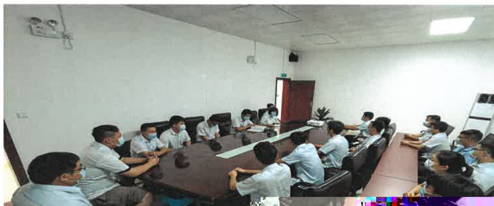
图 2 员工培训

公司 2021 年底现有员工 30 人，公司为员工提供了良好的工作生活环境，注重加强员工的技能培训教育。公司员工的稳定为公司的安全环保生产提供了坚实的基础。